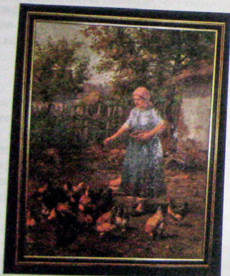
Жена са живином