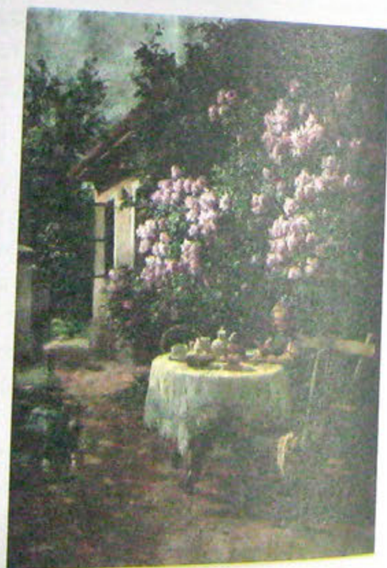
Девојчица под јоргованом