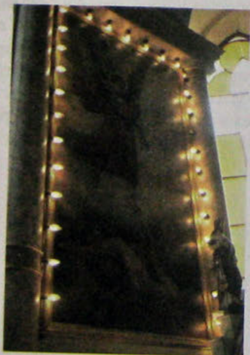
Слика алтара кат. цркве у Јазову