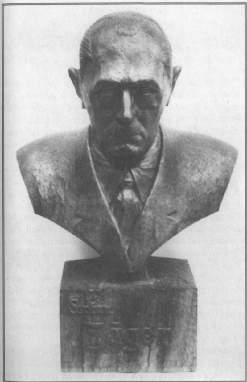
Lucrare în lemn cu bustul lui St. Jäger executată de sculptorul jimbolian Peter Berberich.