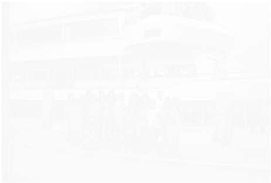
Die Banater Jugendtour der Banater Jugend in Deutschland.

Die vier Tage von der Bodensee- und über die Jugendtour der Banater Jugend in Deutschland. Die vier Tage von der Bodensee- und über die Jugendtour der Banater Jugend in Deutschland.