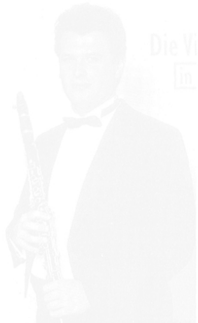
Die Virtuose in

Die kürzlich herausgekommene CD „Die virtuose Klarinette in der Promenadenmusik“ spricht in erster Linie die Freunde der Promenadenmusik an, ein Musikgenre, das in letzter Zeit fast in Vergessenheit geraten ist. Die neue Produktion enthält Bearbeitungen von Stücken aus der Volksmusik, Ausschnitte aus Opern und Operetten, bekannte Kammermusikstücke sowie weitere Bearbeitungen von unterhaltsamen Stücken aus der klassischen Musik.