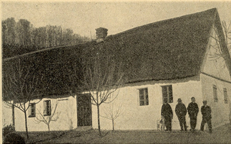
Donauschwäbisches Haus aus der Ansiedlungszeit.