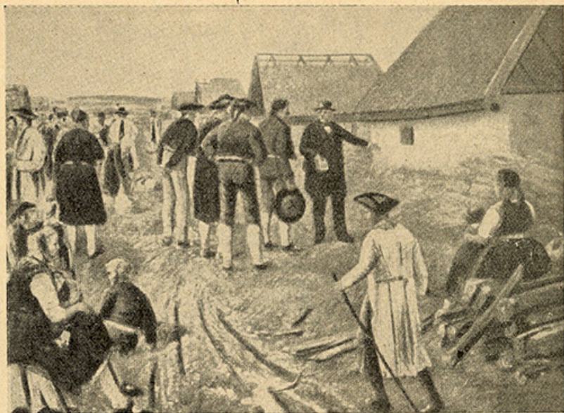
Jäger: Die Einwanderung der Deutschen nach Ungarn im 18. Jahrhundert. Einweisung in Haus und Hof.