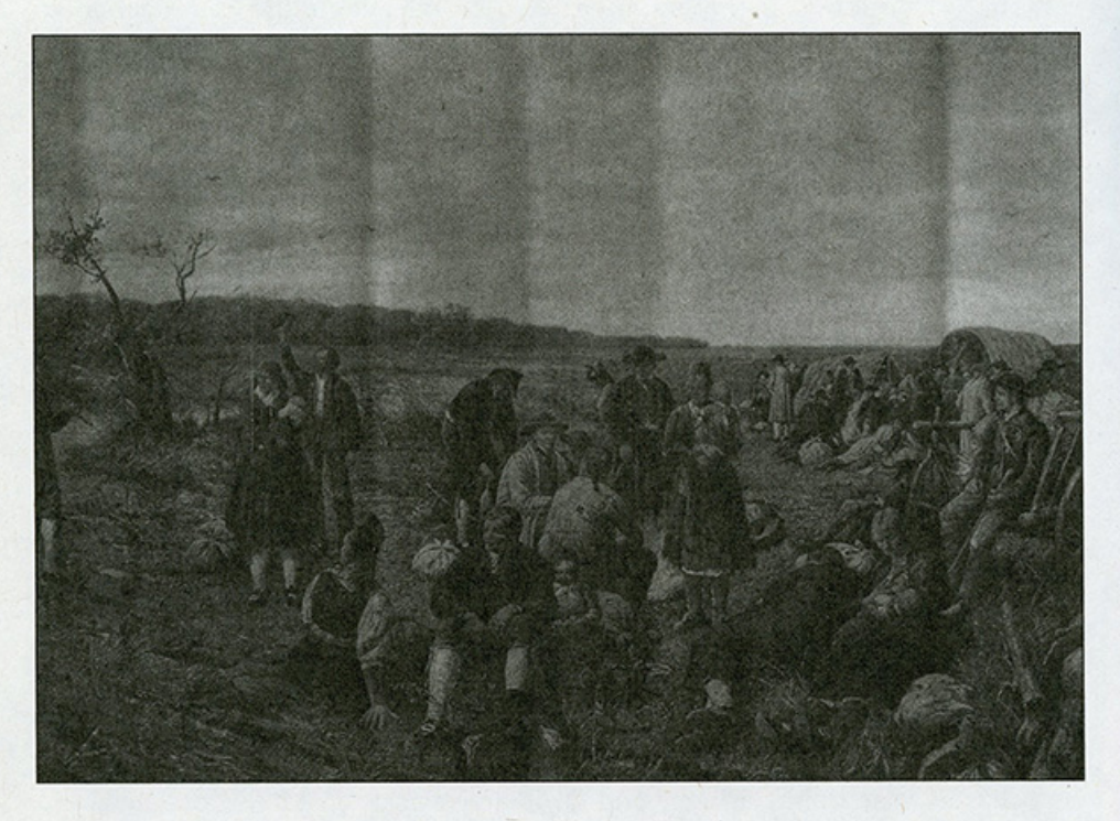
Öl-Bild von Stefan Jäger, dem Schwaben-Maler Ihm gelang es, anschaulich festzuhalten, was sich damals abspielte, als sie auszogen, die Schwaben, um ihr Glück zu suchen.

Das sei dahingestellt und den Gefühlen jeden Friedhofbesuchers selbst überlassen und dessen Feinfühligkeit überhaupt etwas zu sehen, zu hören: "Vergeßt uns nicht."