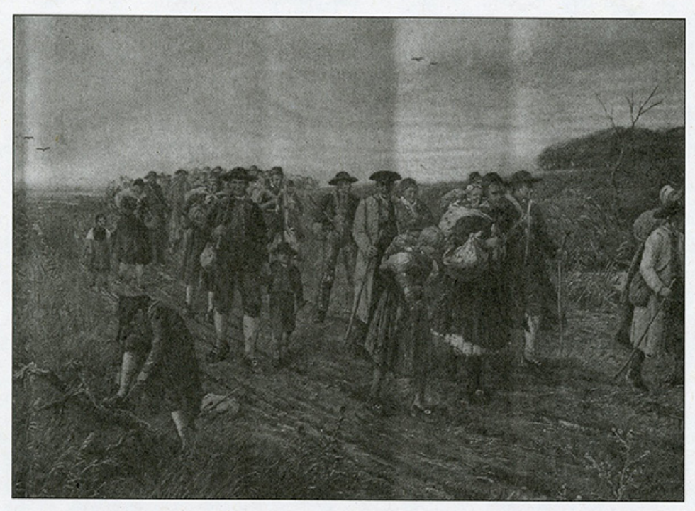
Bildtitel von Stefan Jäger: Einzug der Schwaben in das Banat