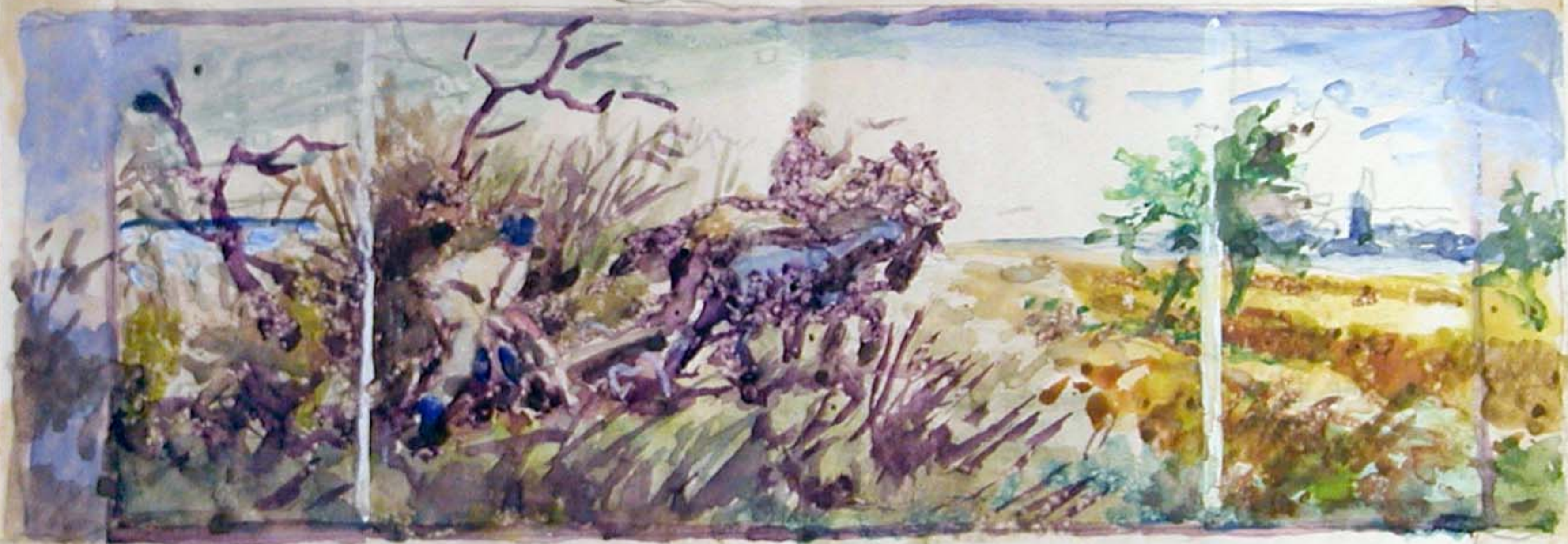
Skizze Nr. 2