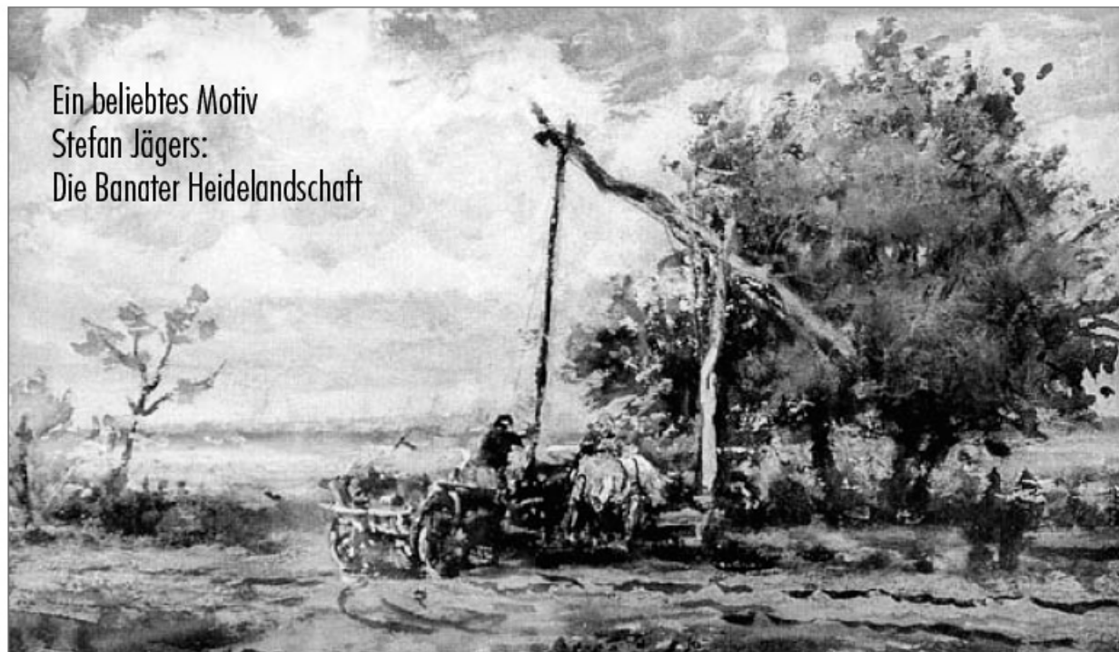
Ein beliebtes Motiv Stefan Jägers: Die Banater Heidelandschaft