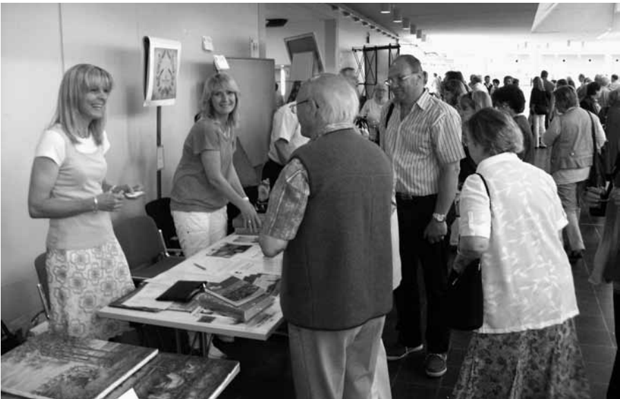
Bücherstand der HOG Hatzfeld beim Heimattag der Banater Schwaben in Ulm