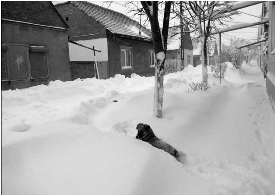
Ungewöhnlich früh und heftig war der Winter 2012/2013 in Hatzfeld. Hier ein Foto der Schneemassen im November 2012 im Futok.