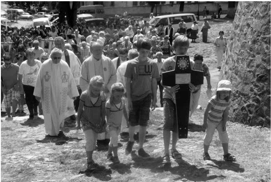
Wallfahrt in Maria Radna mit Hatzfelder Kreuzträger